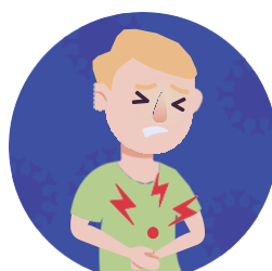
Buồn nôn hoặc nôn mửa