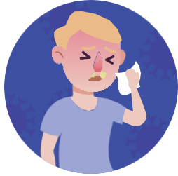
Tắc nghẽn hoặc chảy nước mũi