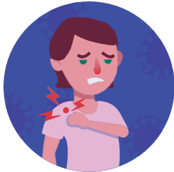
Đau cơ và mệt mỏi